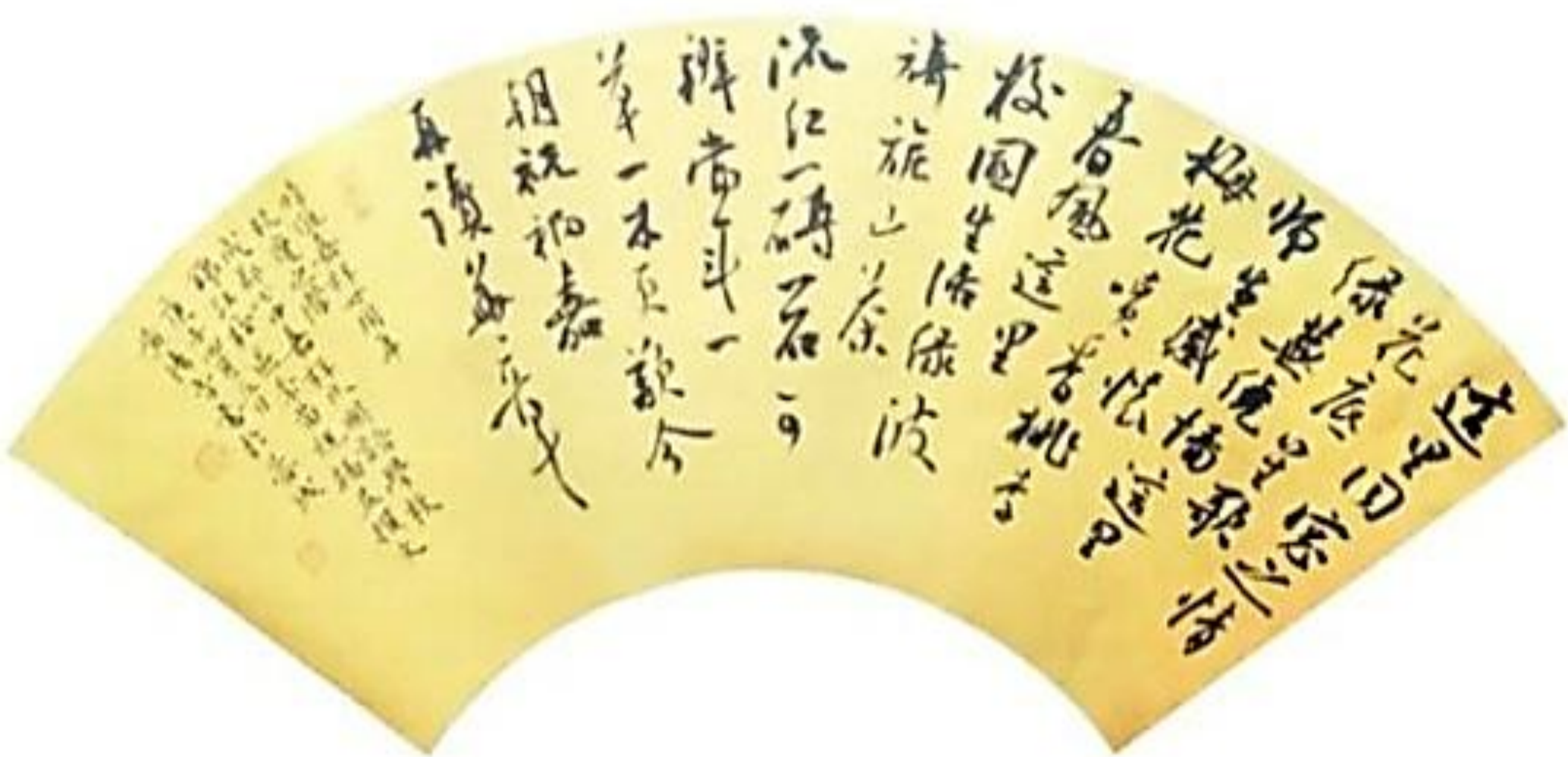
成都嘉祥外国语学校教师 李苗 撰文并书