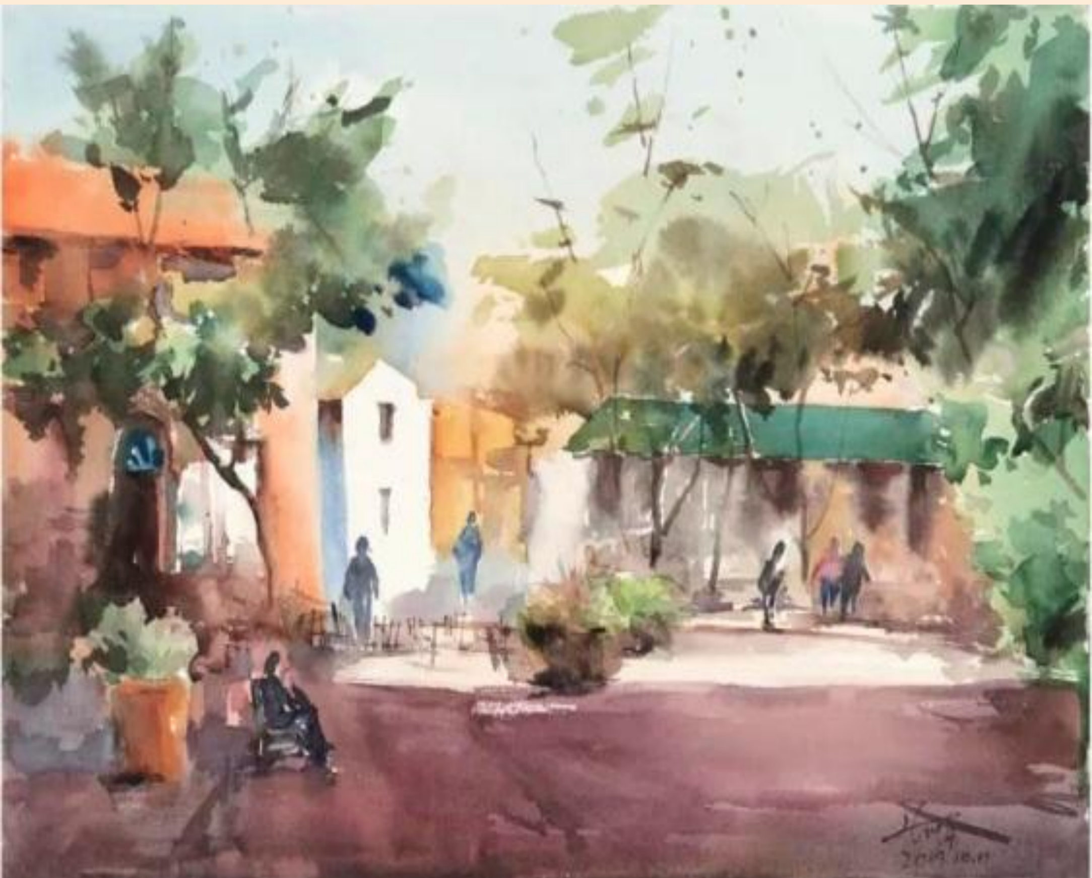
彭州市嘉祥外国语学校教师 张祥源 作