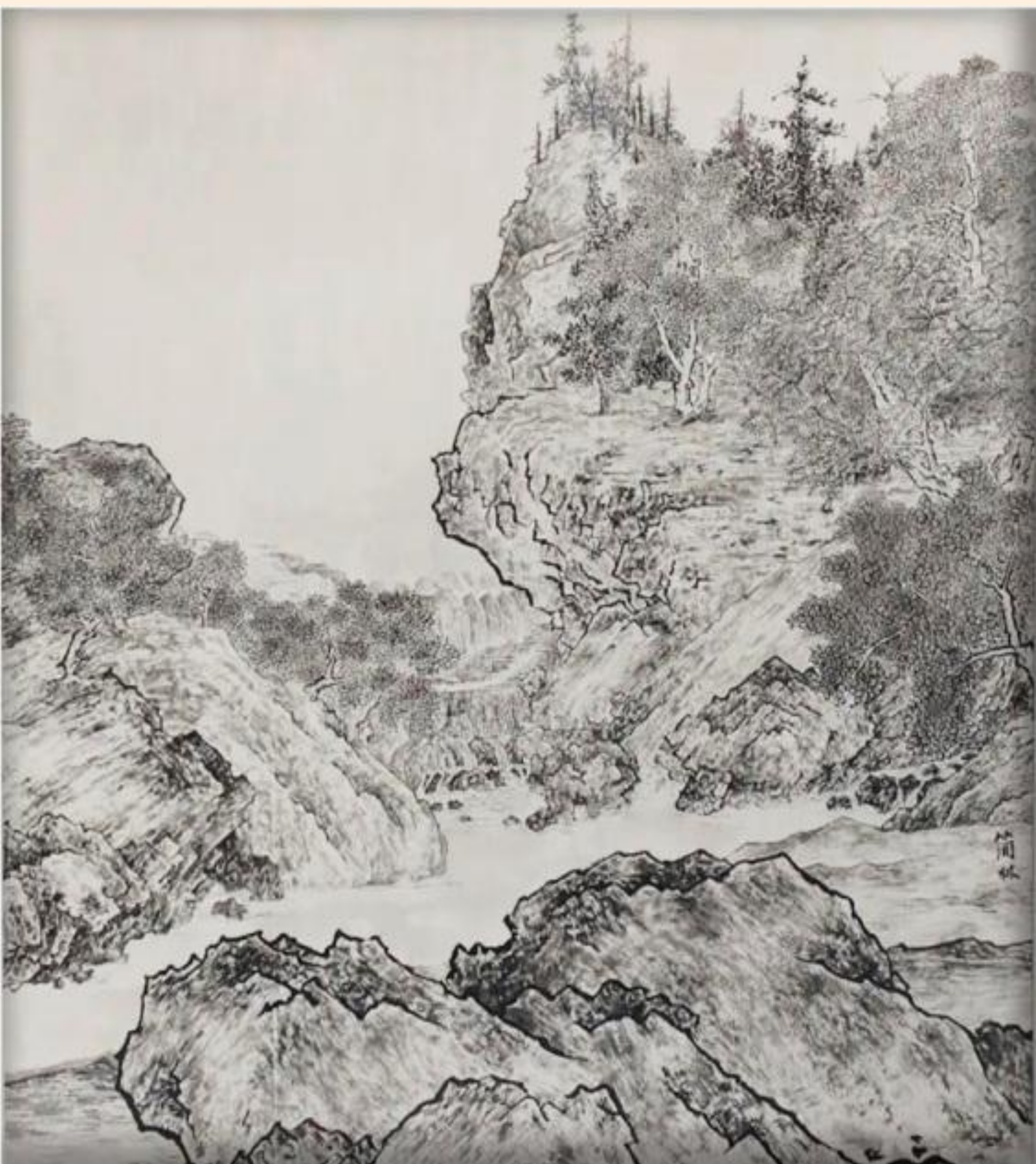
成都嘉祥外国语学校教师 简林 作