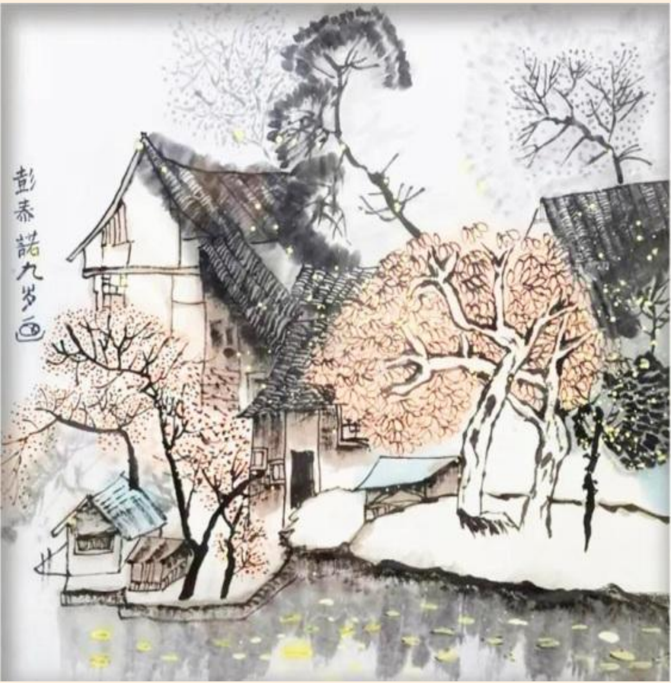
成都嘉祥外国语学校成华校区学生 彭泰诺 作